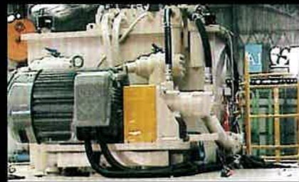
■ 標準配件:防震裝置