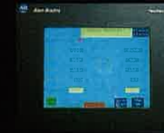
■ 美國AB 觸控式螢幕控制器