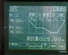
■ 日本三菱 觸控式螢幕控制器