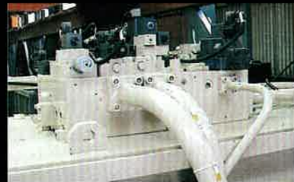
■ 標準配件:邏輯閥回路設計, 油路管道簡單