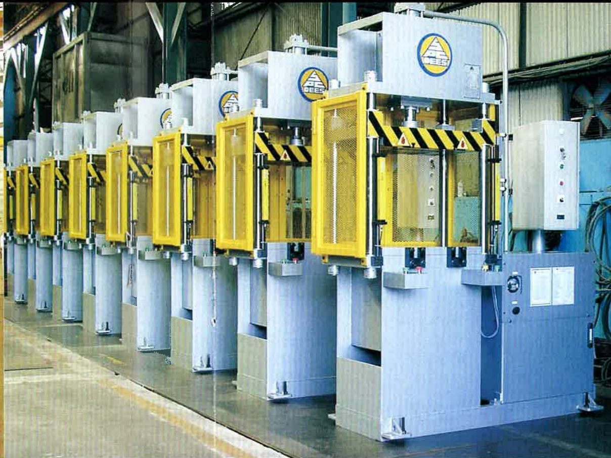
■ 300 TON 四柱型沖床配置美國 ALLEN-BRADLEY 觸摸式螢幕控制器, 可顯示機器全程工作狀態, 若需更高精密控制, 可搭配以下二者其一: — 速度比例閥 — 壓力比例閥